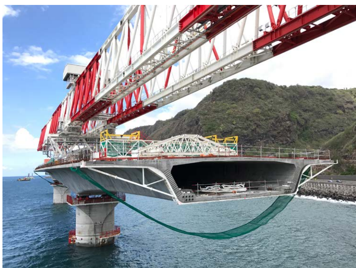
Vue d'une section de tablier du viaduc en mer, constitué de voussoirs préfabriqués en béton posés par un lanceur

Armaturis a fourni les coupleurs Hérisson® qui assurent la liaison (essentielle) entre les embases et les têtes de pile posées par la barge Zourite.