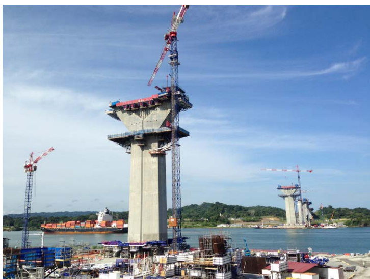
Vue des deux pylônes en cours de construction, ceux-ci permettront de suspendre la travée qui enjambera le canal de Panama