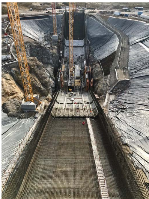
Profond de 28,5 mètres, voici le carneau et ses deux rampes pour évacuer les jets du lanceur Ariane 6

SAMT Ingénierie a conçu avec modélisation en 3D l'ensemble des armatures du carneau qui reste la partie la plus sollicitée de l'ouvrage.